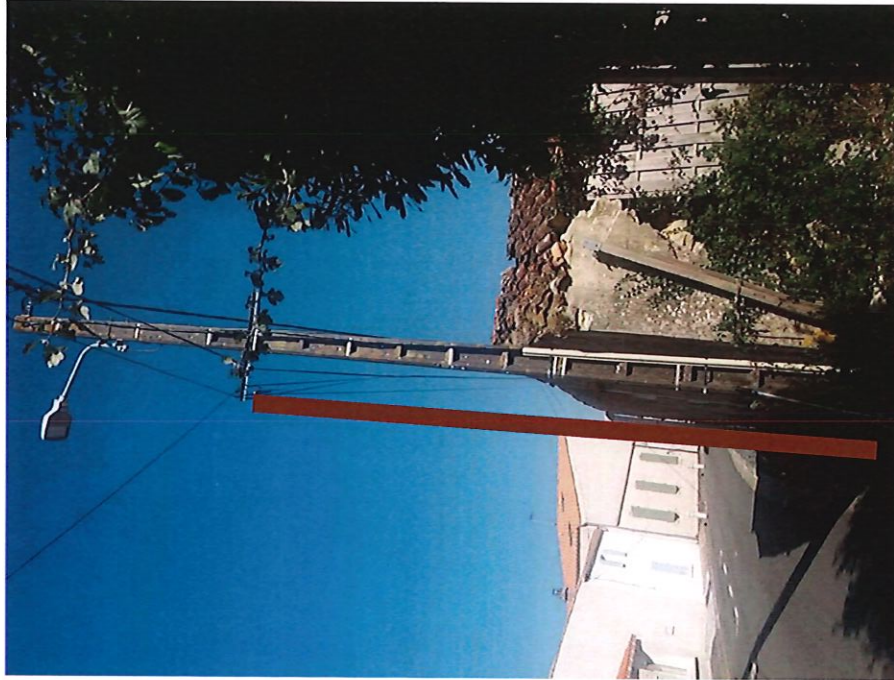
Poteaux composite (fibre) 8m CMTHD N°CM000006 à implanter près du E000023