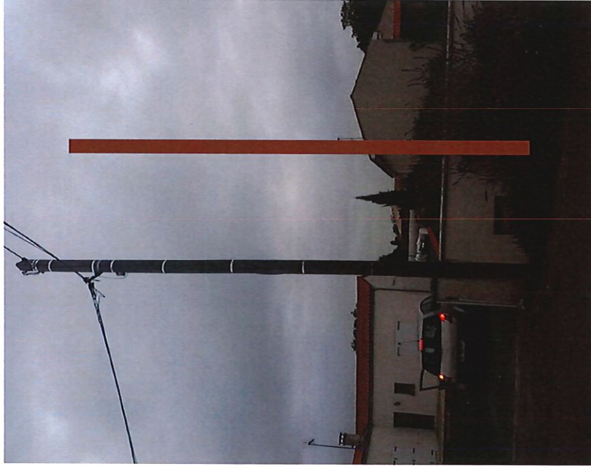
Poteaux composite (fibre) 8m CMTHD N°CM00012 à implanter près du E000014.